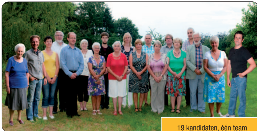
19 kandidaten, één team

Vandaag stellen we onze kandidaten voor. Een stem voor één of meerdere van deze kandidaten is een stem voor echte verandering in Wachtebeke!