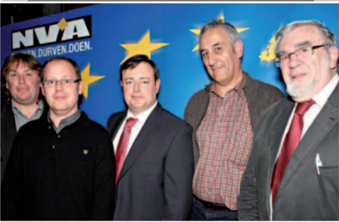
Bart De Wever met een afvaardiging van het N-VA-bestuur van Wachtebeke.

Ons bestuursteam is zich ijverig aan het bijscholen. Intussen hebben we in de voorbije maanden reeds zes dagen vorming gevolgd rond tal van beleidsthema's op gemeentelijk vlak. Want we hebben de ambitie om Wachtebeke op een professionele manier te besturen. Ook Bart De Wever was van de partij.